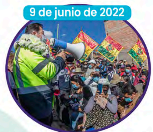
9 de junio de 2022

El Alcalde de Cochabamba Manfred Reyes Villa realizó el lanzamiento oficial de la construcción de la Carta Orgánica Municipal.