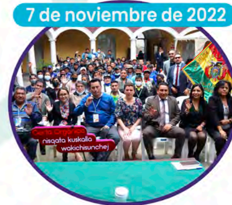
7 de noviembre de 2022

El Alcalde de Cochabamba Manfred Reyes Villa realizó el lanzamiento oficial de la construcción de la Carta Orgánica Municipal.