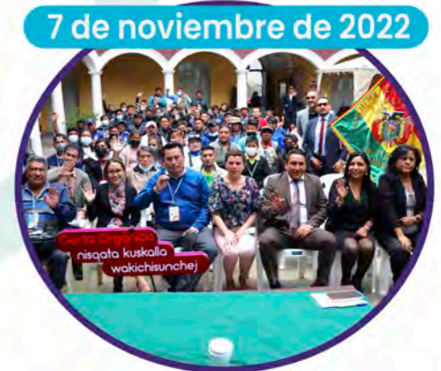
7 de noviembre de 2022

El Alcalde de Cochabamba Manfred Reyes Villa realizó el lanzamiento oficial de la construcción de la Carta Orgánica Municipal.