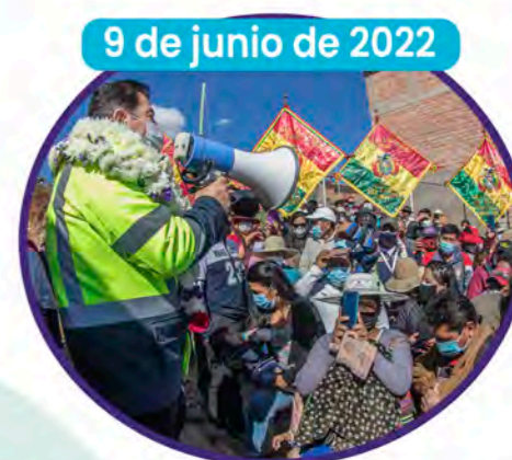
9 de junio de 2022